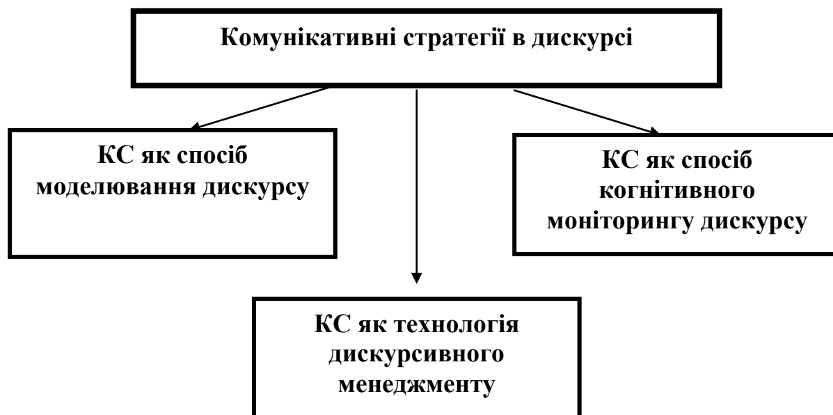
Схема 1. Комунікативні стратегії в дискурсі

Проаналізуємо детальніше особливості кожного зі способів реалізації комунікативних стратегій у дискурсивній комунікації.